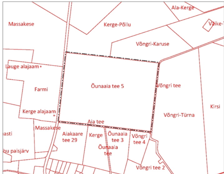
Skeem 3. Ümbritsevad krundid (piirid Maa-amet, 06.10.2021)