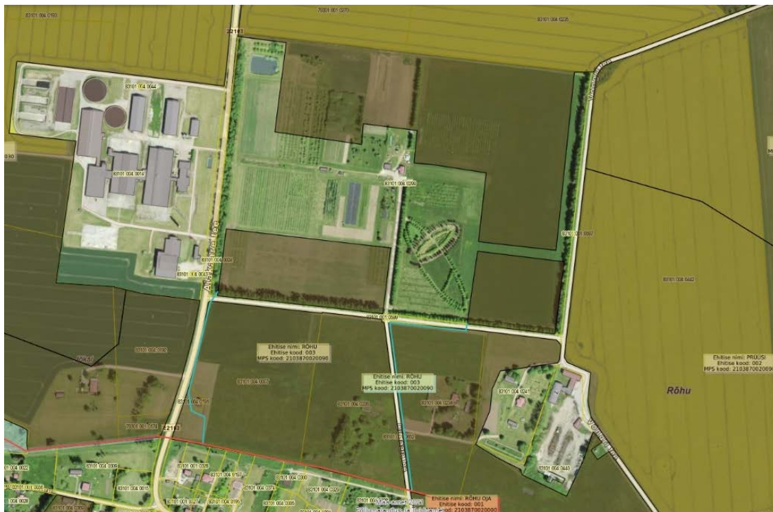
Skeem 5. Olemasolevad maaparandussüsteemid (allikas Maa-ameti maaparandussüsteemide kaardirakendus)

Planeeritava krundi põhja-, kirde-, ida-, kagu- ja edelaosas paiknevad PRÜÜSI (ehitise kood 003, maaparandussüsteemikood 2103870020030) ja RÕHU (ehitise kood 003, maaparandussüsteemikood 2103870020090) maaparandussüsteemid.